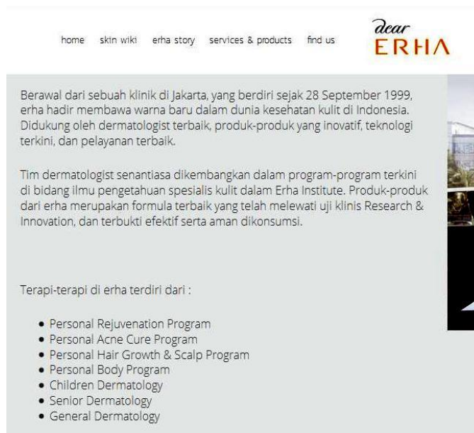
Gambar 4. Berbagai pelayanan dalam wacana “personal” yang ditawarkan oleh Erha 4