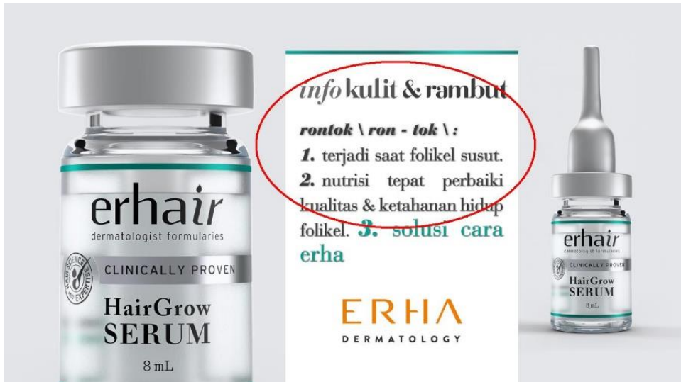
Gambar 1. Poster iklan produk Erha untuk masalah kerontokan rambut dengan Skin Wiki dalam lingkaran merah